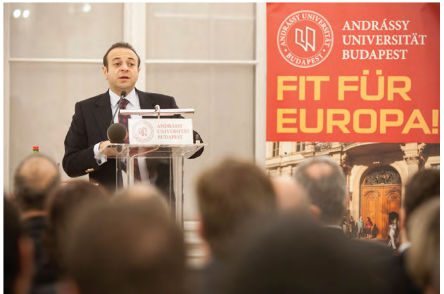
Egemen Bağış, Europaminister der Türkei an der AUB

Im Rahmen einer gemeinsam organisierten Veranstaltung der Türkischen Botschaft in Ungarn und der Andrássy Universität Budapest (AUB), sprach am Donnerstagabend, dem 6. Dezember 2012 Egemen Bağış, erster Europaminister der Republik Türkei und Hauptverhandlungsführer im Rahmen der türkischen Beitrittsverhandlungen mit der Europäischen Union seit 2011 vor zahlreichen Gästen im Spiegelsaal der AUB. Neben dem Botschafter der Republik Türkei in Ungarn, Hasan Kemal Gür waren weitere BotschafterInnen und VertreterInnen der Botschaften von Algerien, Ägypten, Belgien, Bulgarien, Frankreich, Griechenland, Israel, Korea, Mazedonien, Moldawien, Österreich, Pakistan, Palästina, Polen, Rumänien, Serbien, Slowenien und Zypern anwesend. Der Rektor der AUB, Prof. Dr. András Masát, welcher sich erfreut zeigte, vor einem so hoch besetzten Publikum an der AUB zu sprechen, begrüßte Bağış und die Gäste mit kurzen Worten über die AUB und erwähnte die Brisanz, welche das Thema des Vortrages von Bağış in sich hatte. Nach der Rede von Masát gab Botschafter Gür eine kurze Einführung zum englischsprachigen Vortrag mit dem Thema "Changing Dynamics of Turkey-EU Relations: New Opportunities and Challenges" von Bağış. Der türkische Minister ging folgend, ausgehend vom Motto der AUB „Fit für Europa“, welches er auch zu seinem Motto erklärte, auf