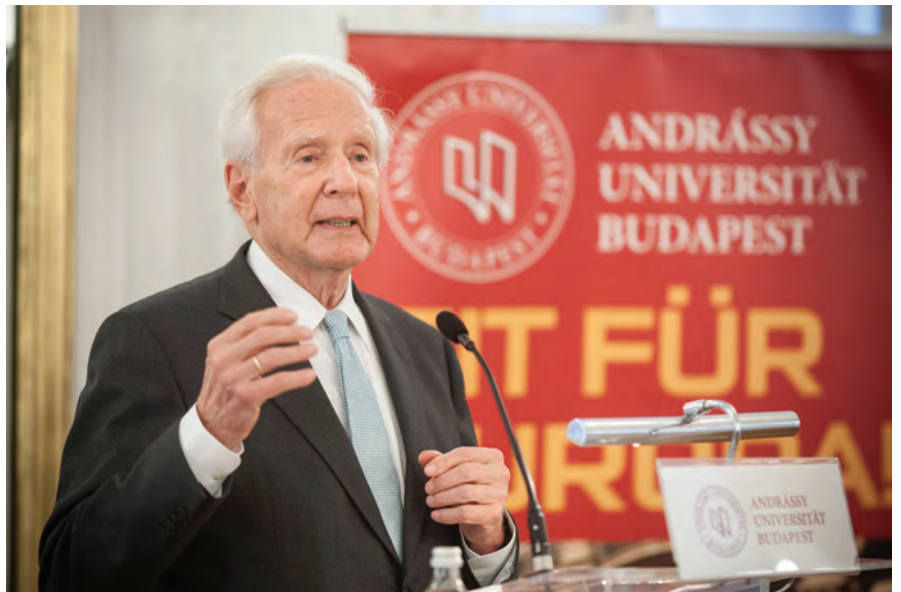
Klaus von Dohnanyi, Bundesminister a.D. über die deutsch-ungarischen Beziehungen