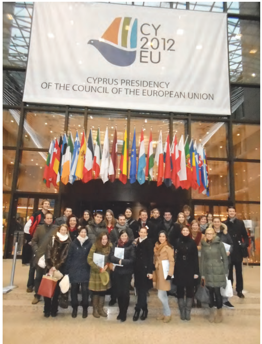
Die Studierenden in Brüssel bei der Europäischen Kommission

Am nächsten Tag hat die Gruppe den Vormittag und auch das Mittagessen in der NATO verbracht, wo die Studierenden sich mit Vertretern der ungarischen und deutschen Delegation unterhalten konnten. Am Abend fand ein gemeinsames Abendessen statt, bei