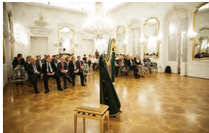
Festliches Jubiläum - 10 Jahre Unterricht an der AUB

DLA Piper, Konrad-Adenauer-Stiftung, LeitnerLeitner, netPOL - Interuniversitäres Netzwerk politische Kommunikation, Österreichisches Kulturforum Budapest / COMPRESS, Österreichisch-Ungarische Europa-schule, Siemens Zrt., Swisscham Hungary - Handelskammer Schweiz-Ungarn, Rödl & Partner und UNION Biztosító / Vienna Insurance Group.