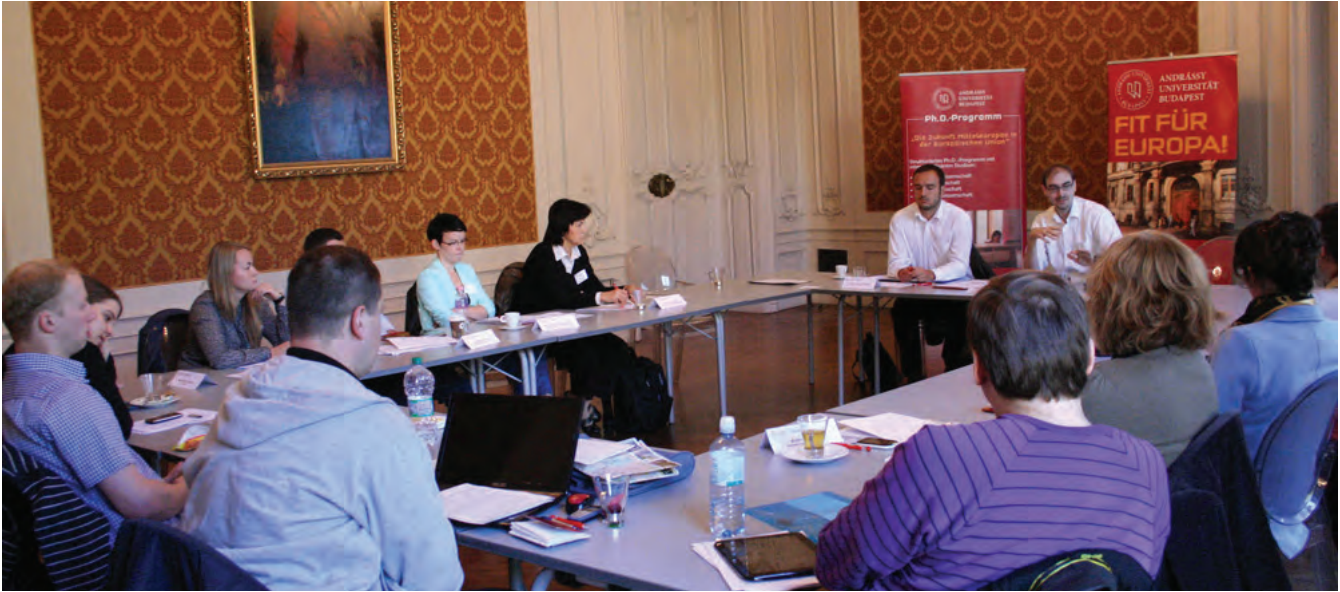
Internationaler Doktorandenworkshop im Andrássy-Saal zum EU-Skeptizismus