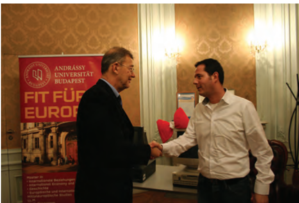
Übergabe von PCs und Bildschirmen vom Rektor der AUB an die Mikulášgyár, 13.12.2012