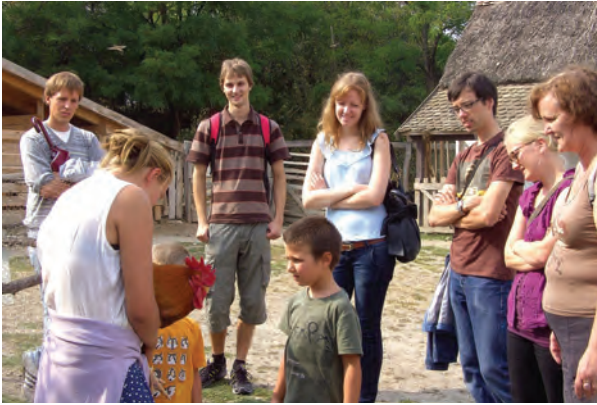
„Storchenlager“ für die AUB-Erstsemesterler in Skanzén, 01.09.2012