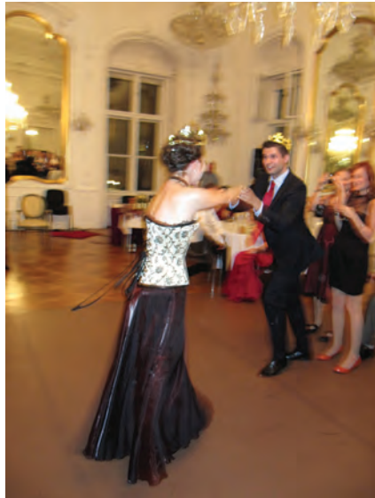
Ballkönigin und -könig beim Tanz