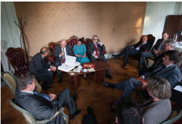
Im Zimmer des Rektors zum Besuch des Landeshauptmann von Südtirol, Dr. Luis Durnwalder, 26.09.2012