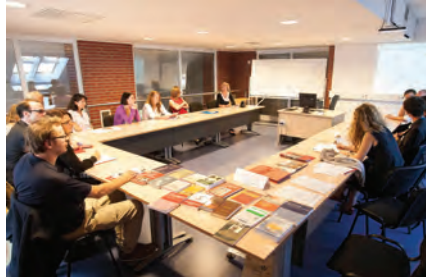
Das netzwerkbildende Programm der Doktorschule und des Donau-Instituts