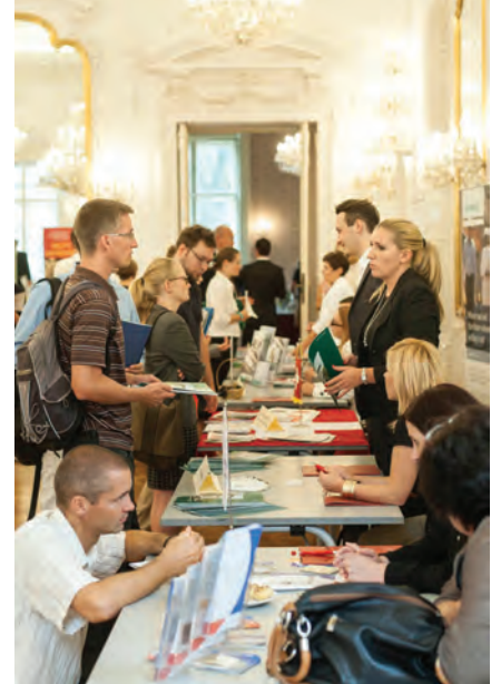
Zahlreiche Studierende informieren sich bei den Ausstellern auf der Karrieremesse

Am Nachmittag fanden die netzwerkbildenden Programme der drei Fakultäten, der Doktorschule und des Donau-Institutes statt. Es wurden unter anderem die verschiedenen Studiengänge vorgestellt, Masterarbeiten, Dissertationsprojekte und Forschungsarbeiten präsentiert und Diskussionen zu verschiedenen Themenbereichen geführt. Die Fakultäten luden Alumni ein, um über ihre Erfahrungen im Studium, ihren Berufseinstieg und ihre derzeitige Arbeitsstelle zu berichten. Bei dieser Gelegenheit konnte das Netzwerk der Fakultäten intern und mit externen Interessierten verstärkt werden. Zum Abend desselben Tages lud der Rektor der AUB, Herr Prof. Dr.