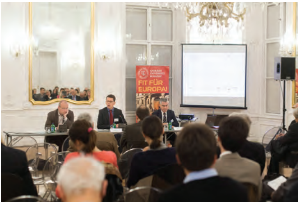
Podium bei der Konferenz „Politische Kultur in der Demokratie – Herausforderungen für Politiker und Bürger“, 11.10.2012