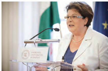
Die Bayerische Landtagspräsidentin Barbara Stamm während ihrer Rede