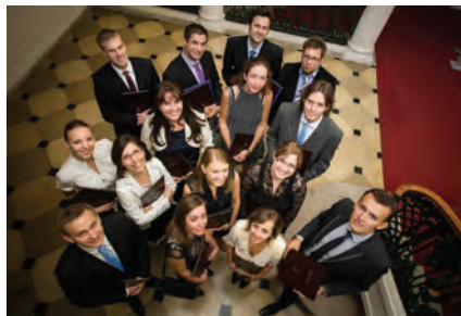
Die stolzen AbsolventInnen freuen sich über den erfolgreichen Abschluss