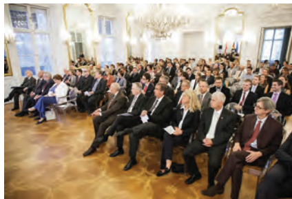
Zahlreiche Gäste füllten den Spiegelsaal

Im Anschluss wurde auch die Kooperation der AUB mit der Otto-