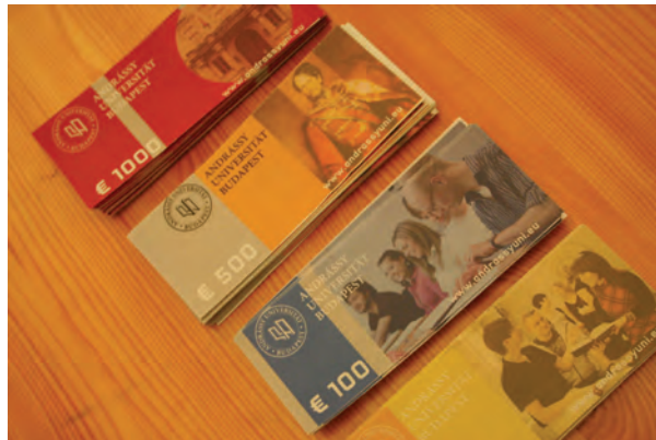
Andrássy-Geldscheine für das ökonomische Experiment bei der Nacht der Forschung, 28.09.2012