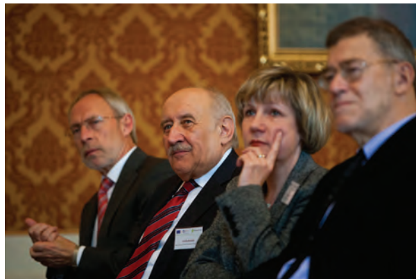
Fokussiertes Interesse zur Konferenz „Liebe zu alten Lasten oder Angst vor neuen Fehlern? Zur Lage des Konservatismus im 21. Jahrhundert“, 30.11.2012