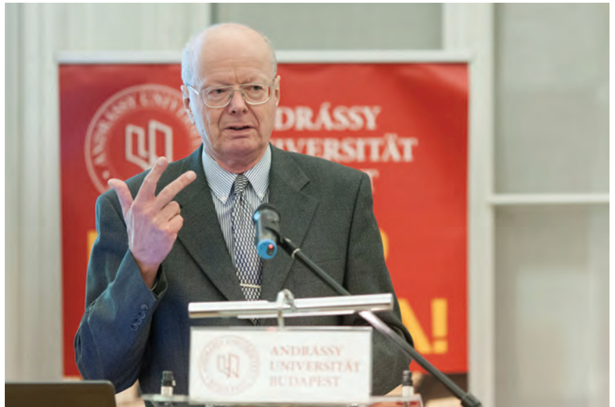
Prof. Zimmermann über die drei Krisen

musste wieder in Gang gebracht werden. Zu diesem Zwecke wurden finanzielle Mittel wie Infrastrukturausgaben und politische Signale wie die Opel-Rettung eingesetzt. Keynes zitierend verwies er darauf, dass in einigen Ländern wie Deutschland die „Pumpe“ bloß angegossen werden musste, in anderen aber eine komplette Neukonstruktion der „Pumpe“ notwendig sei. „Pumpe“ steht dabei als Sinnbild für ein funktionierendes Wirtschaftssystem. Dies bildete auch die Überleitung zur Staatsschuldenkrise, die uns aktuell noch betrifft. In einigen Staaten der Eurozone zeichnete sich die „Fehlkonstruktion der Pumpe“ schon frühzeitig ab. Durch die Einführung des Euros konvergierten die Zinssätze. Damit konnten auch Staaten mit Wirtschaftssystemen, die strukturelle Probleme aufweisen, zu günstigen Zinssätzen Geld aufnehmen, was die Problematik verschlimmert habe. Im letzten Teil seines Vortrags schlug Prof. Zimmermann den Bogen zum Vortragsort Budapest und stellte die Frage, wie die Schuldenkrise ein Nicht-Euro-Land wie Ungarn betreffe. Nach Darlegung der verschiedenen Faktoren