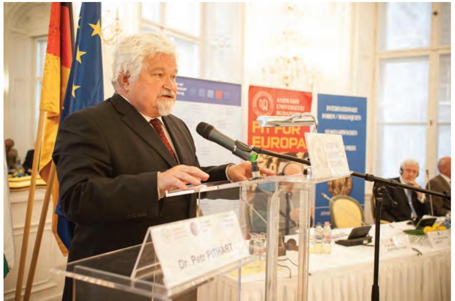
Auch der Preisträger selbst sprach während des internationalen Kolloquiums

Im anschließenden Panel „Rolle und Möglichkeiten der Visegrád-Gruppe in der Gestaltung des künftigen