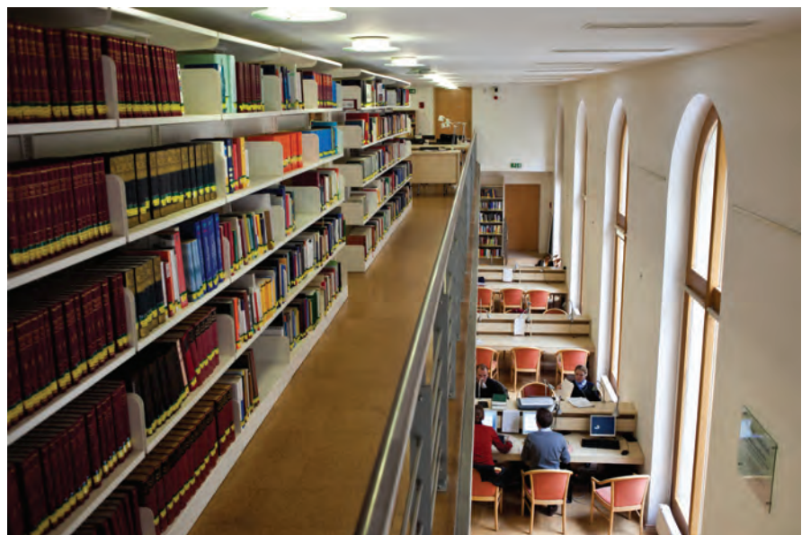
Auf zwei Etagen finden Studierende und Interessierte in der Universitätsbibliothek über 20.000 Medien

Für die Studierenden stehen im Bereich der Bibliothek 7 Computerarbeitsplätze mit Internetanschluss zur Verfügung. An den übrigen 16 Arbeitsplätzen sowie den Dauerarbeitsplätzen auf der Galerie ist die Arbeit mit eigenem Laptop möglich, der über WLAN mit dem Internet verbunden werden kann. Im Bereich des Lesesaals ist ein Kopierer/Drucker aufgestellt, den die Studierenden benutzen können. Ein Scanner, der an einem der PC-Arbeitsplätze angeschlossen ist, kann ebenfalls genutzt werden.