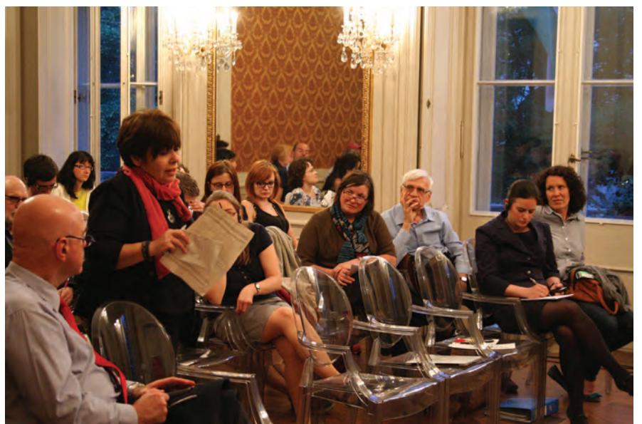
Zahlreiche Gäste stellten ihre Fragen an das Podium. Ebenso anwesend war der israelische Botschafter in Ungarn (ganz links).

der Erwähnung der antisemitischen Aufkleber an der ELTE – im März d. J. waren Aufkleber mit dem Spruch „Juden! Die Universität gehört uns, nicht Euch“ am Lehrstuhl für Philologie der ELTE aufgetaucht – stellten die Panelisten fest, dass es in der ungarischen Sprache keine Terminologie für „politisch korrekte“ Formulierungen gäbe und dass insgesamt in der ungarischen Gesellschaft in Bezug auf die Frage