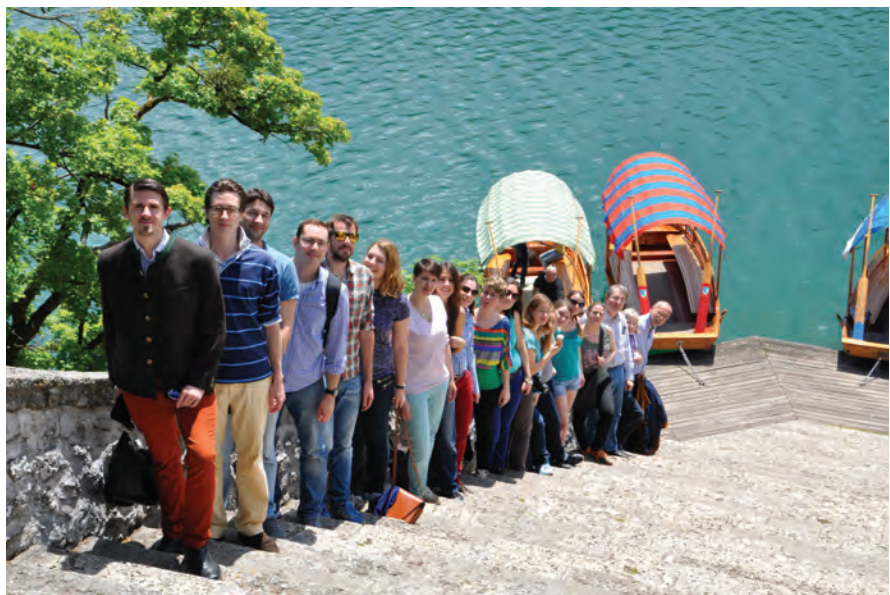
Gruppenfoto am Bleeder See

Der erste Exkursionstag (5. Juni 2013) stand im Zeichen der ehemaligen österreichisch-ungarischen Südwestfront im Abschnitte des auf slowenischem Gebiet gelegenen Isonzotals. Den Höhepunkt des Tages, den Dr. Richard Lein gestaltet hatte, bildete der Besuch in dem von einer europäischen Friedensinitiative aufgebauten Museums in Kobarid, das sich zum Ziel gesetzt hat, das Gedenken an die Ereignisse in dem Gebiet in den Jahren 1915-1918 zu bewahren. Weitere Stationen des Tages bildeten der Soldatenfriedhof in Log