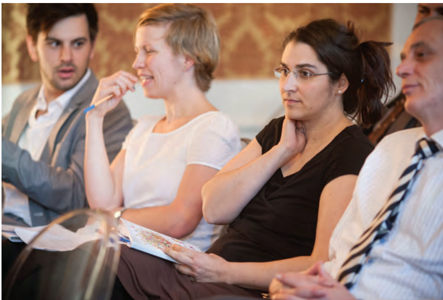
Angeregt und interessiert folgten die Gäste der Tagung den Beiträgen