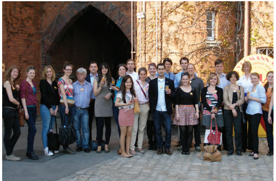
Die Exkursionsgruppe beim Mälzereibesuch in Bamberg

Das Programm begann am 24. April mit einem Besuch in der Bayerischen Staatskanzlei. Michael Hinterdobler, Leiter des Bereichs Europapolitik und Internationale Beziehungen, trug zum Thema „Die internationalen Beziehungen Bayerns in der Donauregion, insbesondere zu Ungarn“ vor. Er erläuterte detailliert, mit welchen Instrumenten die Staatskanzlei die internationalen Beziehungen im Interesse des Freistaates Bayern pflegt. Hierzu gehört auch die Förderung von Einzelprojekten im Ausland, wie etwa das bayerische Engagement für die AUB. Herr Hinterdobler gab auch einen Überblick darüber, wie Bayern sich zu einem High-Tech-Standort entwickelte. Die maßgeblichen Elemente, die diese Entwicklung ermöglichten, waren die Förderung von Innovationen und des Exports. Im Anschluss an das Gespräch fand eine Führung durch die Staatskanzlei statt. Weiter ging es zu einem anderen architektonisch beeindruckendem Gebäude: dem Bayerischen Landtag. Dort fand zunächst ein Gespräch mit VertreterInnen der Fraktionen des Ausschusses für Hochschule, Forschung und Kultur statt. Obwohl es ein sehr ereignisreicher Tag im Landtag