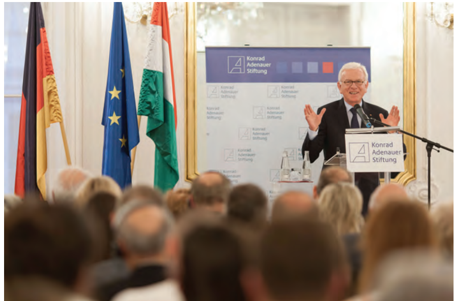
Hielt eine wahre Europarede - Dr. Pöttering im Spiegelsaal der AUB