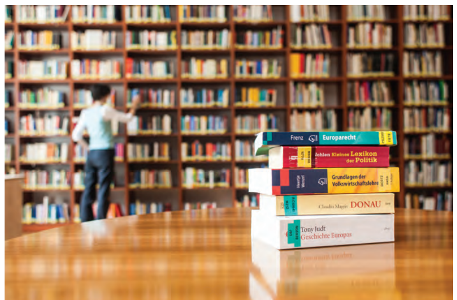
In der Bibliothek des Österreichischen Kulturforums Budapest finden sich ca. 7.000 Bücher

organisiert. Das Kulturforum veranstaltet weiterhin Lesungen, in deren Rahmen das Publikum die Möglichkeit bekommt, seine Fragen an die jeweiligen Autoren zu stellen.