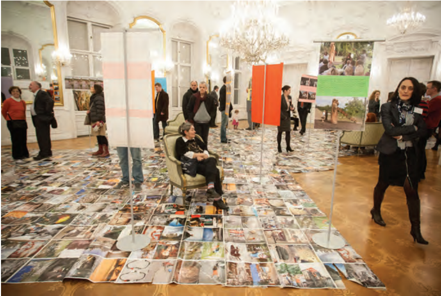
Im Rahmen der Konferenz wurde ebenso die Fotoausstellung „Roma in Ungarn“ von Alexander Schikowski eröffnet

referierten anschließend über die Rückkehr von vertriebenen Deutschungarn nach dem Zweiten Weltkrieg, wobei Herr Sparwasser die Rückkehrer aus der sowjetisch besetzten Zone (SBZ) untersuchte. Die Vertreibung der Ungarndeutschen sei systematisch und willkürlich erfolgt. In der SBZ erfuhren die Ungarndeutschen existenzielle Not, so konnte Deutschland nicht zur neuen Heimat werden und viele entschieden sich zur Rückkehr, die in Ungarn unerwünscht war und seitens der Behörden bekämpft wurde. Meist gelang sie nur dank der Hilfe der heimischen Bevölkerung.