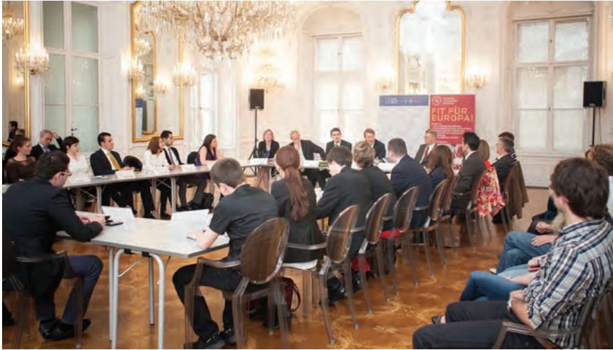
Das Gespräch mit Herr Pofalla im Spiegelsaal bildete den Abschluss der Studentenkonzferenz

Gruppen von vier bis sechs Personen ein, um die vorher erarbeiteten Ergebnisse der vergangenen beiden Tage gemeinsam zu besprechen, theoretisch zu verorten und ein Resümee hinsichtlich der gesamteuropäischen Europäisierung zu ziehen. Durch die unterschiedlichen Expertisen der Studenten und die neu gewonnen Erkenntnisse der Konferenz entwickelte sich zum Schluss eine lebhaft Diskussion um den Status quo, Entwicklungstendenzen und Zukunftsprognosen.