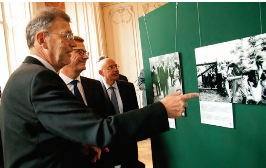
Der Rektor der AUB und die beiden Minister im Gespräch während der Eröffnung der Ausstellung

Nach den beiden Reden eröffnete dann Gergely Pröhle die Fotoausstellung „40 Jahre – 40 Bilder“ und die Gäste konnten die Ausstellung im Andrassy-Saal besichtigen, welche später auch im Auswärtigen Amt in Berlin gezeigt werden wird. Die Ausstellung zeigt dabei 40 Fotografien von historisch bedeutsamen Momenten aus 40 Jahren diplomatischer Beziehungen zwischen Deutschland und Ungarn, worunter sich zum Beispiel auch ein Bild vom Besuch der deutschen Bundeskanzlerin, Dr. Angela Merkel an der AUB im Jahr 2007 befindet.