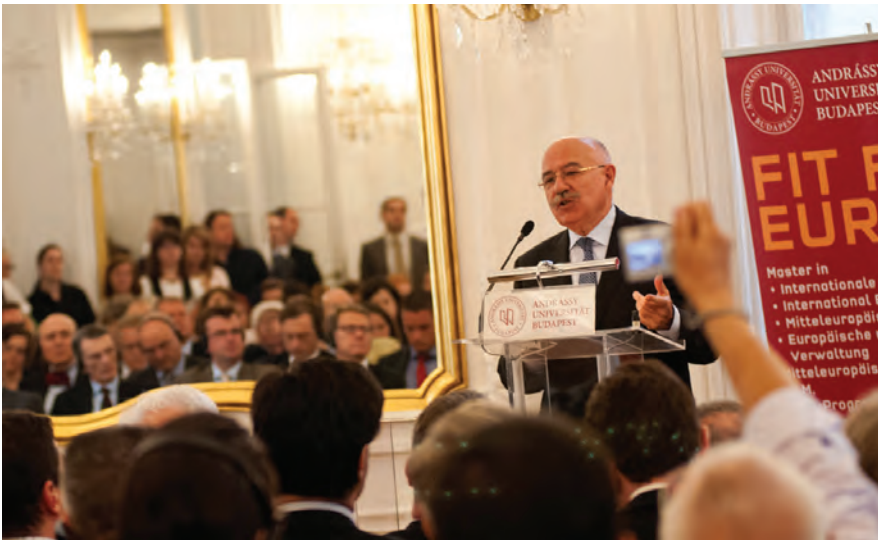
Der ungarische Außenminister Martonyi sprach über gemeinsame Werte

Deutschlands und Europas seien jetzt Geschichte, dennoch gilt es daran zu erinnern. Die AUB ist dabei ein Produkt der deutsch-ungarischen Freundschaft und der historischen Beziehungen. Westerwelle sprach im Namen des deutschen Volkes die Dankbarkeit gegenüber dem ungarischen Volk für den Mut 1956 aus. Heute gilt es ein geeintes Europa zu verwirklichen, welches im globalen Kontext nur geeint als Schicksals- und Kulturgemeinschaft bestehen kann. Europa ist dabei das erfolgreichste Friedensprojekt der Geschichte. Der Dreiklang aus Solidarität, Solidität und Wachstum ist die dafür notwendige Grundlage. Bildung und Ausbildung sind die Zukunft und die