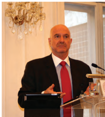
Der Botschafter sprach über die Situation Israels

Mor, der nicht zuletzt auf Grund einer zweimaligen Dienstperiode an der israelischen Botschaft in Deutschland ein nahezu perfektes Deutsch spricht, sieht derzeit in jener Region, in der auch sein Heimatland liegt „alles in Bewegung“. Das größte Konfliktpotential sieht der Botschafter beim Verhältnis zum Iran, da dieser nicht nur den rhetorischen Druck auf Israel laufend erhöhen und Israel jegliches Existenzrecht absprechen