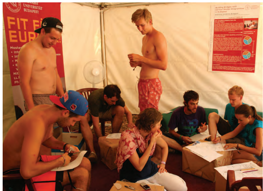
Das ökonomische Spiel und anderes Programm sorgten bei Festivalatmosphäre auf dem Civil Sziget für Abwechslung

Bei den kurzweiligen Quizspielen und Fragen zu Bräuchen, der Geschichte und Politik in Mitteleuropa konnten die Besucher selbst aktiv werden. Die Quizspiele waren meist ein gelungener