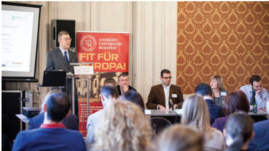
Der Rektor der AUB (hier am Podium) eröffnete die Konferenz