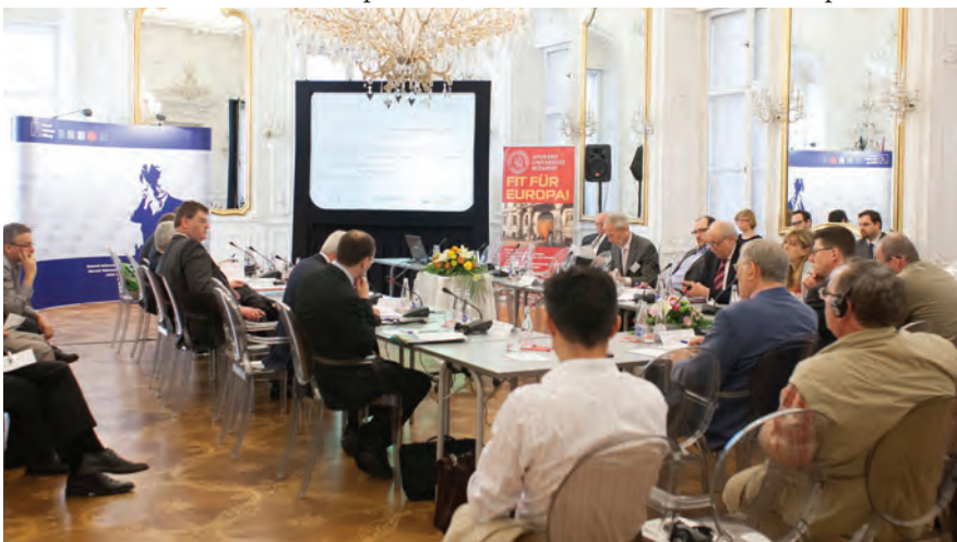
In vier Panels diskutierten Experten vor Gästen im Spiegelsaal