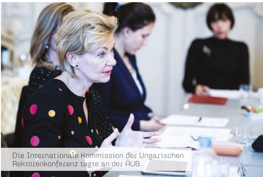
Die Internationale Kommission der Ungarischen Rektorenkonferenz tagte an der AUB.

Sitzung der internationalen Kommission der Ungarischen Rektorenkonferenz