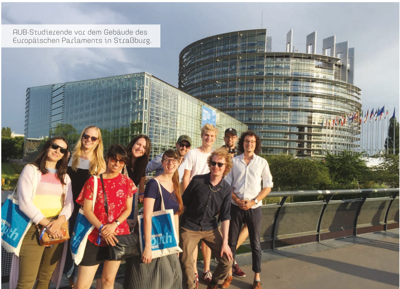
AUB-Studierende vor dem Gebäude des Europäischen Parlaments in Straßburg.