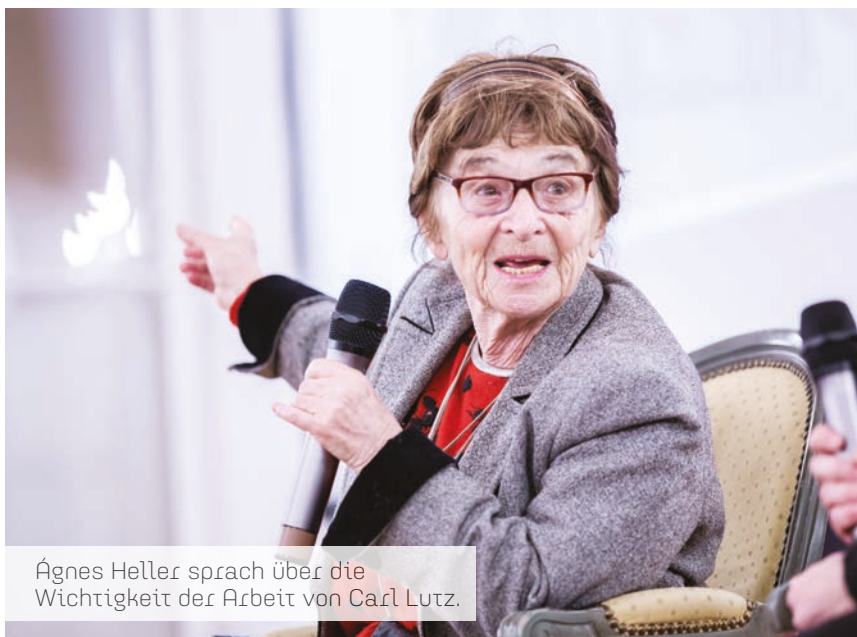
Ágnes Heller sprach über die Wichtigkeit der Arbeit von Carl Lutz.

erzählte, wie schwierig dies gewesen sei und dass man sich trotz des Besitzes eines Schutzpasses nicht immer in Sicherheit gefühlt habe. Es habe viele Leute gegeben, die das Leben der Juden retten wollten. „Jeder, der uns gerettet hat, ist für uns ein Beispiel“, betonte Heller und fügte noch hinzu, wie wichtig es sei, die Erinnerung an die Arbeit dieser Menschen für die jüngere Generation zu bewahren.