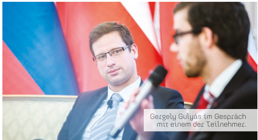
Gergely Gulyás im Gespräch mit einem der Teilnehmer.

Im zweiten Teil diskutierten Gergely Gulyás, Ministerpräsidialamt von Ungarn sowie Tobias Zech, Verband der Reservisten der Deutschen Bundeswehr e.V., über die Bedeutung der V4 auf die Zukunftsperspektive Europas. Diskutiert wurden Themen wie Migration oder der Schutz der europäischen Außengrenze, aber auch die aktuelle innenpolitische Debatte in Deutschland bezüglich der Flüchtlingsthematik.