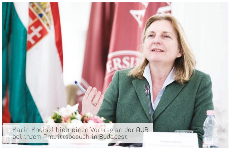
Karin Kneissl hielt einen Vortrag an der AUB bei ihrem Antrittsbesuch in Budapest.