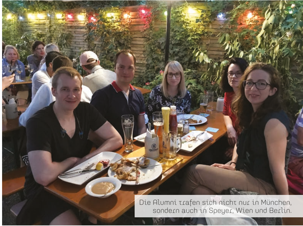
Die Alumni trafen sich nicht nur in München, sondern auch in Speyer, Wien und Berlin.

Nach der allgemeinen Begrüßung und dem gegenseitigen Vorstellen kam es schnell zu den Fragen, die alle brennend interessierten: Welche Veränderungen gibt es an der AUB? Sind noch bestimmte Professoren oder Dozenten an der AUB? Was gibt es sonst an spannenden Neuigkeiten? Wir stellten schnell fest, dass unsere