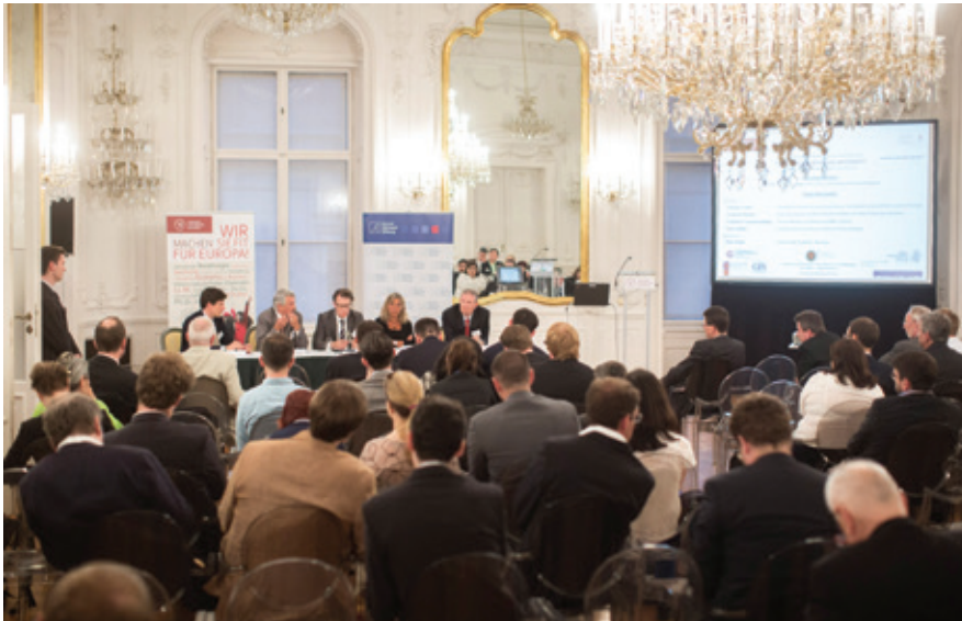
Die Podiumsdiskussion zu „Time for a European Internet?“ im Spiegelsaal der AUB.