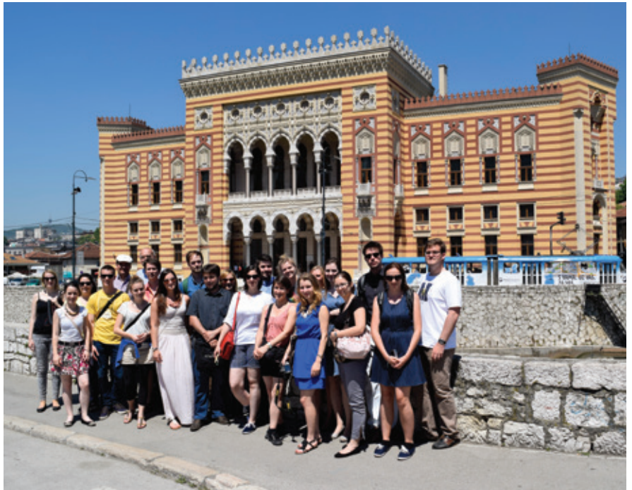
Gruppenfoto vor der Nationalbibliothek in Sarajevo.

Am 4. Juni verließen wir Sarajevo, wo wir in jenem Hotel gewohnt hatten, in dem während der Belagerung der Stadt die letzten verbliebenen Auslandskorrespondenten ihre Unterkunft hatten und welches jetzt nach der Renovierung ein wenig den Charme der jugoslawischen Selbstdarstellung während der Olympischen Winterspiele spiegelt, um nach Mostar in die Herzegowina zu fahren. Eindrucksvoll konnte auf dieser Fahrt wiederum der Versuch, über Sakralbauten die Landschaft „national“ zu besetzen, studiert werden. Fertigteilmoscheen und ebensolche Kirchen, die zumeist jegliche Proportion vermissen lassen, bilden den Auftakt. Das osmanische, muslimische Mostar wird von einem neuen Kirchturm und einem Gipfelkreuz überragt, damit katholisch-kroatisch kontextualisiert und durch