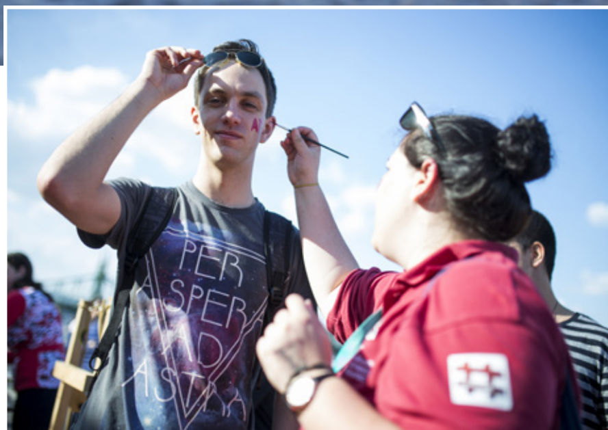
Im Fan-Lager der AUB wurde fleißig geschminkt.