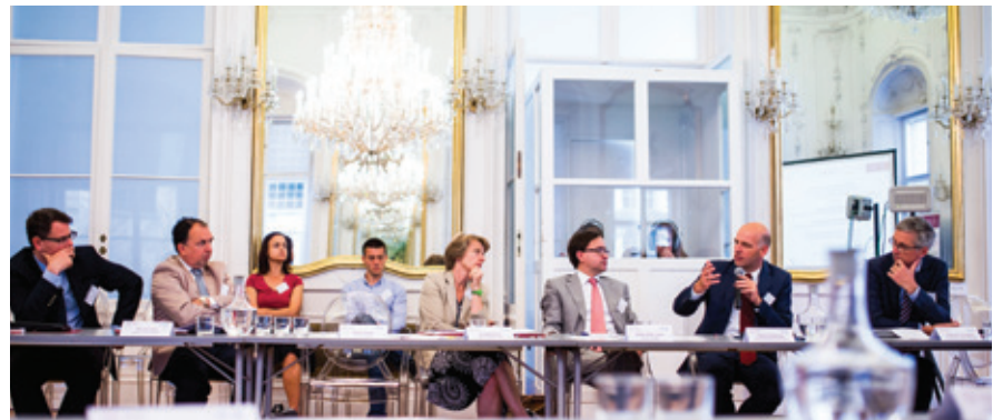
Teilnehmer:innen und Teilnehmer des Workshops im Spiegelsaal der AUB.

Die erste Abteilung richtete zunächst den Blick auf den vom Europarecht ge-