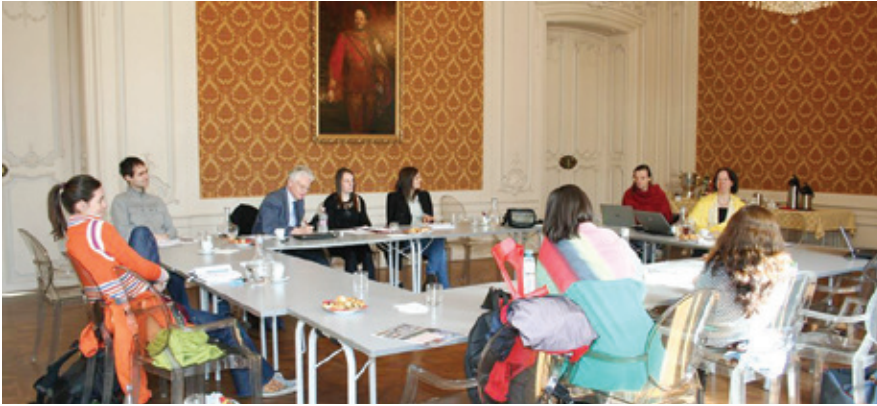
Der Workshop fand in den historischen Räumen des Festetics-Palais statt.

Erster von DoktorandInnen durchgeführter PhD-Methodenworkshop an der AUB zu qualitativen und quantitativen empirischen Methoden