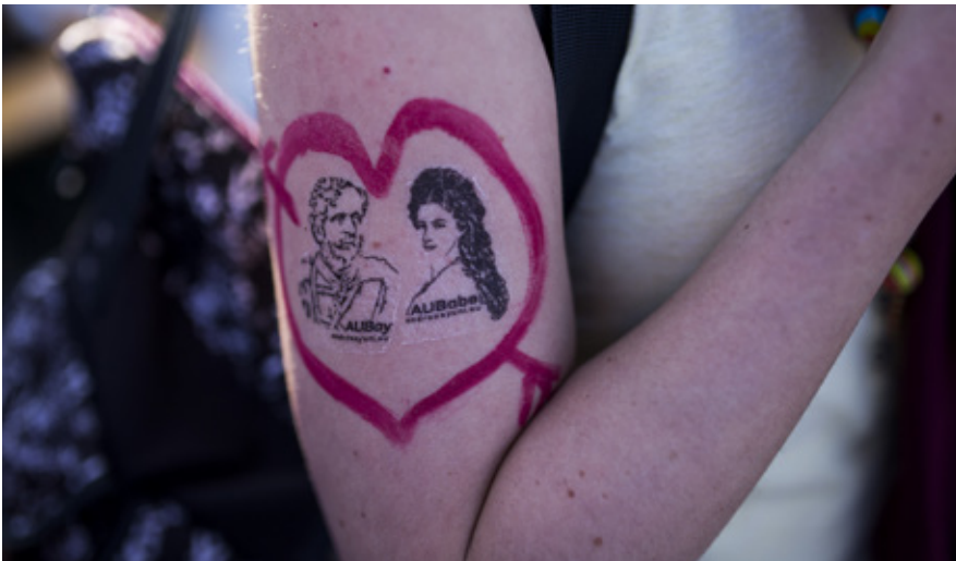
Graf Andrássy und Kaiserin Sissi zierten die AUB-Fans beim Wettkampf.