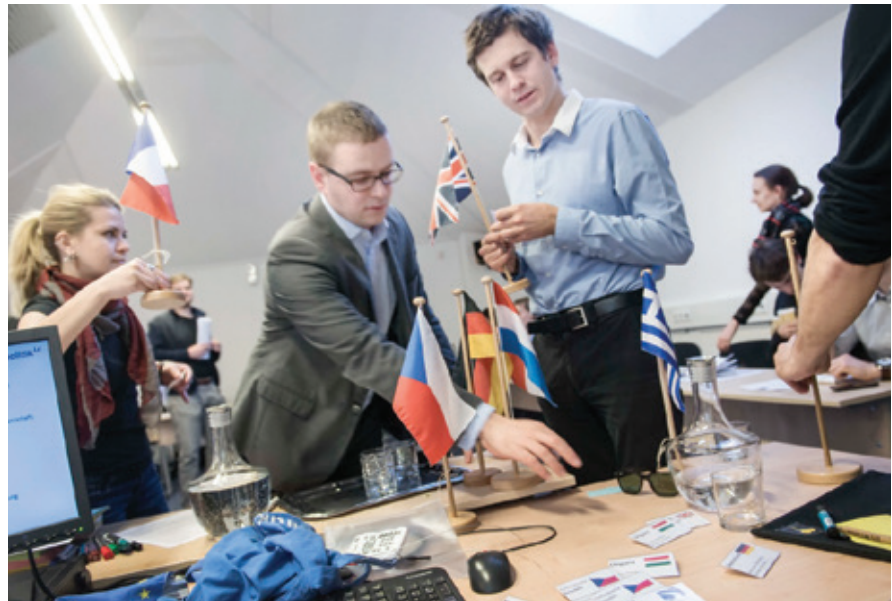
Studierende bereiten sich auf die simulierte Ratssitzung vor.

Zur Vorbereitung hatten die Studierenden die inhaltlichen Interessen des von ihnen vertretenen EU-Landes identifiziert und sich somit in die realen aktuellen Themen der Europäischen Union (z. B. zum Ukraine-Konflikt, zur Wirtschaftskrise oder zum Flüchtlingsdrama im Mittelmeer) eingearbeitet. Die Verhandlungen wurden sehr ernst- und lebhaft geführt und führten zu einer