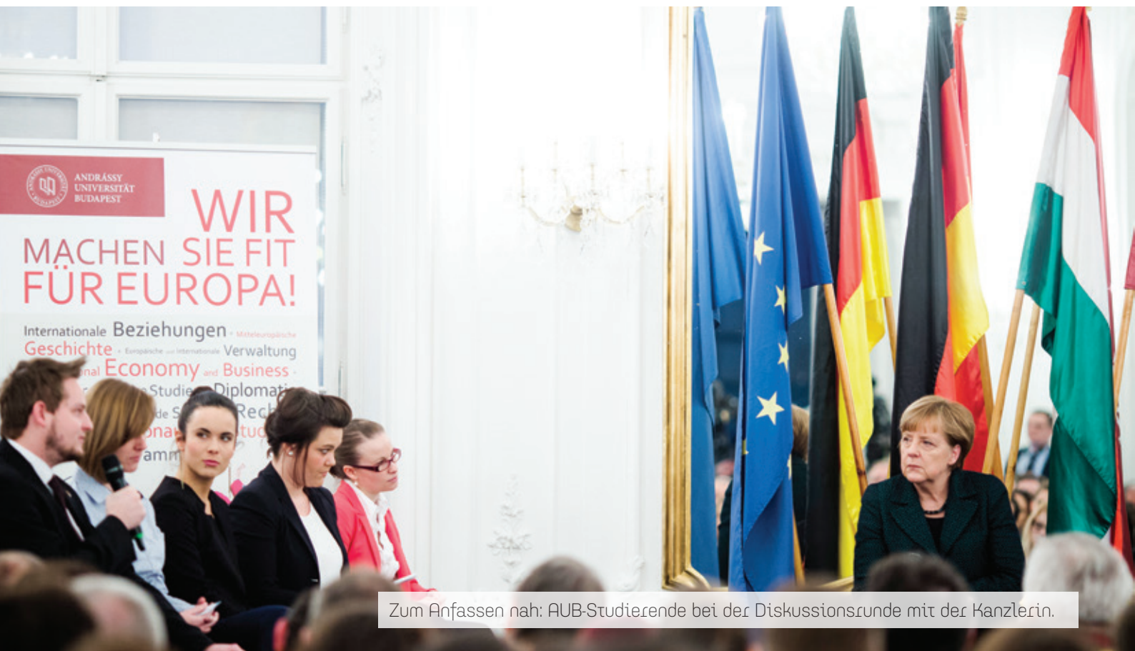
Zum Anfassen nah: AUB-Studierende bei der Diskussionsrunde mit der Kanzlerin.

Auch ich hatte eine Frage zur Karriere in der Politik: Ich wollte von ihr wissen, welche Ratschläge sie als bedeutendste Frau in der Welt der Politik gerade uns Studentinnen geben könnte, um später erfolgreich eine politische Laufbahn einzuschlagen. Ihre Antwort war einfach: „Erstmal etwas Vernünftiges studieren und dazu ein bisschen Praxiserfahrung sammeln“. Und sie unterstrich: „Frauen sind wie Männer: Sie sollten also an sich glauben, den eigenen Weg machen und sich nicht unterkriegen lassen, aber auch nicht beleidigt sein, wenn man mal verliert“. Im Falle einer Niederlage solle man dann als Frau nicht denken, dass der Grund dafür das „Frausein“ sei: „Das passiert Männern auch“, so Merkel.