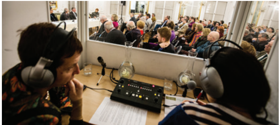
Die Diskussion wurde simultan gedolmetscht, sodass auch nichtungarischsprachige Gäste die Möglichkeit hatten, Fragen an Németh und die anderen Teilnehmer zu richten.

Németh antwortete überaus ausführlich, was das zahlreich erschienene Publikum sichtlich genoss: Hier sprach jemand, der Einblicke in für Außenstehende kaum bekannte Details in die inneren Zirkel der damaligen Macht gab. Er berichtete über die äußerst schwierigen Bedingungen, unter denen im hochverschuldeten