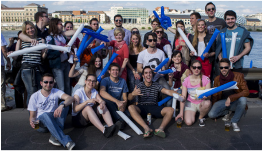
Am Ziel warteten die Fans der Mannschaft auf ihr Team und feierten sie auf den letzten Metern an.

Amateur-Drachenbootmannschaft der Studierenden tritt erstmalig bei Ungarns größtem Uni-Sportereignis an