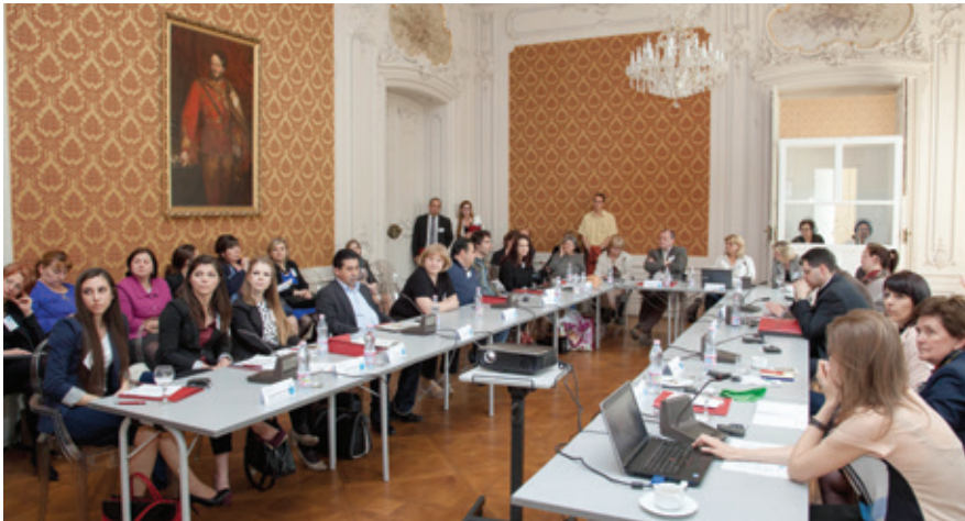
Repräsentanten verschiedener ungarischer Institutionen diskutierten die Bildungspolitik in Bezug auf die Integration der Roma.

Husz v. a. die Praxis jener Eltern, die ihre Kinder entweder nicht in Schulen mit hohem Roma-Anteil anmelden oder sie aus solchen gar wieder herausnehmen würden. Das Motto laute hier „Integration ja, aber nicht in meinem eigenen Hinterhof“, so Husz.