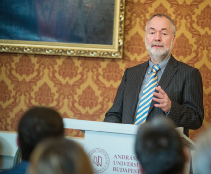
Markus Meckel über die Bedeutung der „Versöhnung über den Gräbern“ und das gemeinsame Erinnern.

Der Präsident des Volksbundes Deutscher Kriegsgräberfürsorge e.V. zur europäischen Erinnerungskultur