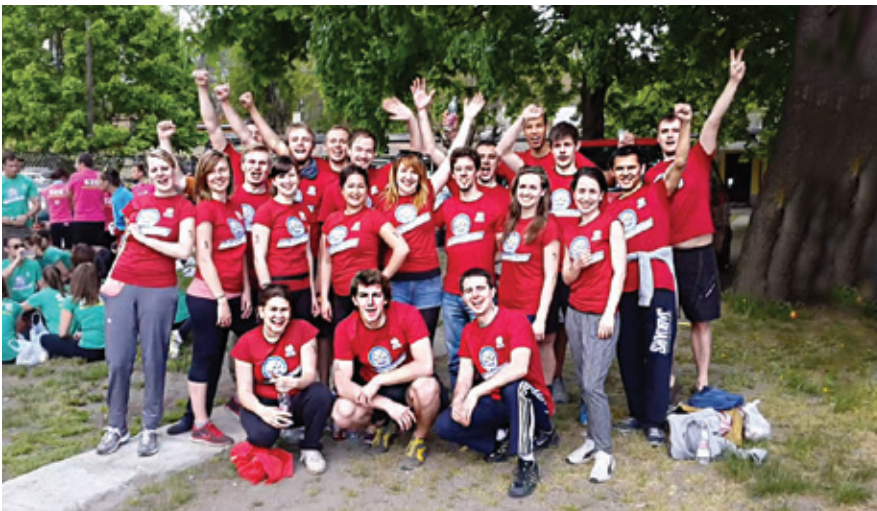
Das AUB-Drachenbootteam 2015.

Im Sommersemester 2015 maß sich unsere kleine Uni nun auch sportlich mit den „Großen“: Zum ersten Mal trat ein AUB-Team zum Amateur-Drachenbootrennen bei der „Dunai Regatta“ (Donau-Regatta), dem größten universitären Sportfestival Ungarns, gegen einige der größten ungarischen Universitäten an.